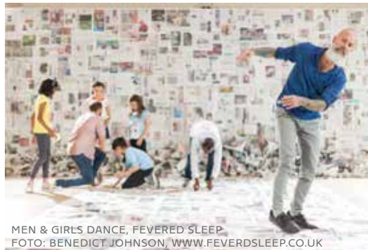
MEN & GIRLS DANCE, FEVERED SLEEP

Veranstalter: Museum für moderne und zeitgenössische Kunst *